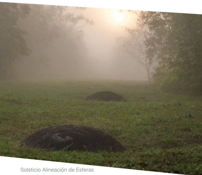
Solsticio Alineación de Esferas

The Diquís stone sphere sites are globally recognized pre-Columbian patrimonial heritage.