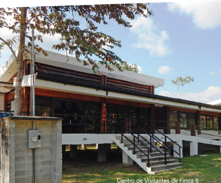
Centro de Visitantes de Finca 6

Los sitios con esferas de piedra del Diquís son una herencia patrimonial precolombino de reconocimiento mundial.