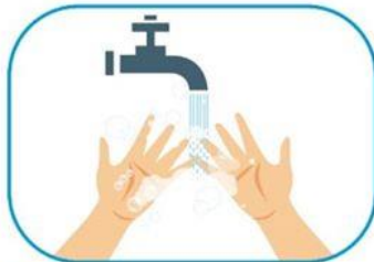
1 Lavado de manos