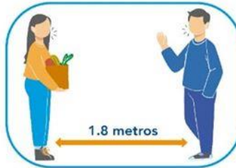
5 Distanciamiento social