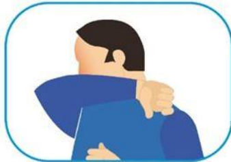
4 Protocolo de estornudo y tos