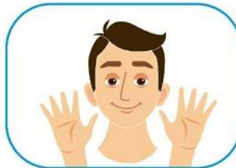
2 No se toque la cara si no se ha lavado las manos