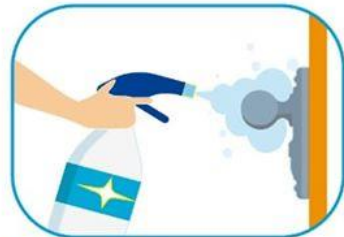
3 Limpiar las superficies de alto contacto