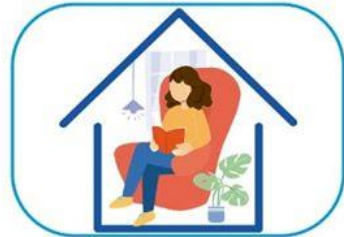
6 Quedate en casa