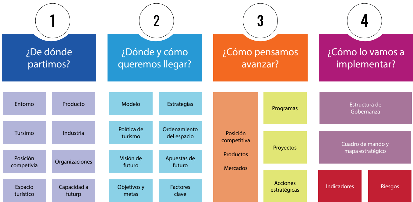
Figura 2. Secuencia de fases para la actualización del PNT 20027-2032

La secuencia de fases y contenidos mínimos de cada etapa está detallada en la figura 3. Los contenidos y alcances de lo que se debe considerar para desarrollar adecuadamente cada uno de los cuadros señalados en esta figura 3. En los archivos de la dirección constan los documentos ( en forma de cuadros) en los que se explica y amplía el contenido mínimo de cada una de las partes señaladas en los respectivos cuadros de la figura 3.