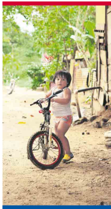
WIDER RIL Die Pazifikküste Costa Ricas ist weltweit beliebt bei Surfern. Ein junger Tico, so nennen sich die Einheimischen, blüht lieber an Land und fährt mit Rad über die Schotterpisten.

71.059 - 7 - MSC - TZ - 35832531 - REX - ///; (L)