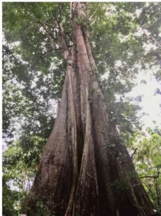
Au milieu de cette forêt surgissent quelques immenses fromagers (PB)

La balade permet de s'immerger dans une exubérante végétation tropicale : les arbres courent jusqu'au ciel, des broméliacées et d'autres plantes épiphytes les colonisent, des lianes en tous genres les escaladent. Souvent, des fougères arborescentes jaillissent au milieu de la mousse et des lichens.