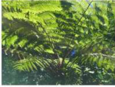
... et aussi d'innombrables fougères arborescentes qui se jouent de la lumière (PB)

Dans cette forêt humide qui aligne au moins, dit-on localement, « 600 nuances de vert », le randonneur est assuré d'apercevoir de grosses tortues aquatiques, des iguanes, des coatis, des singes hurleurs qui sautent au sommet de la canopée, des paresseux, des perroquets, des toucans, des colibris et quelques extraordinaires papillons bleues. Il verra aussi d'interminables processions de fourmis portant d'énormes morceaux de feuilles sur leur dos. Parfois, il apercevra un serpent. Par précaution, mieux vaut ne pas s'aventurer hors des sentiers et porter des chaussures fermées.