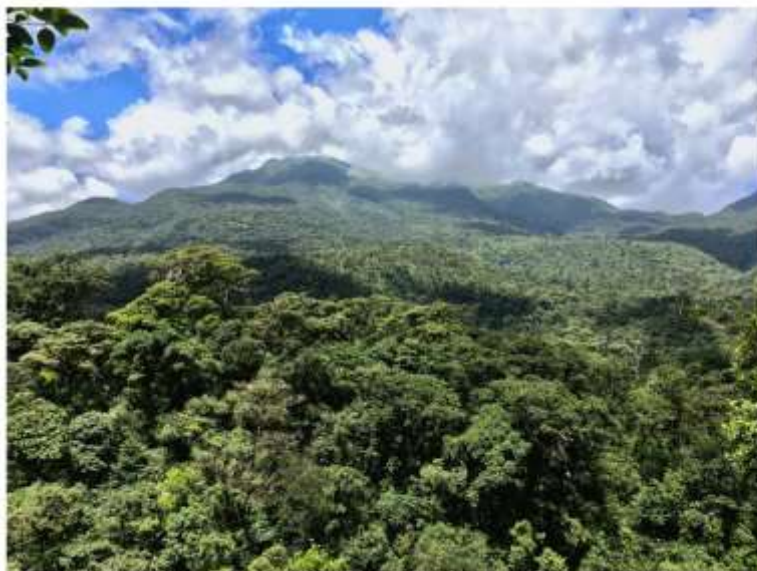
Le volcan Tenorio perdu, comme souvent, dans les nuages