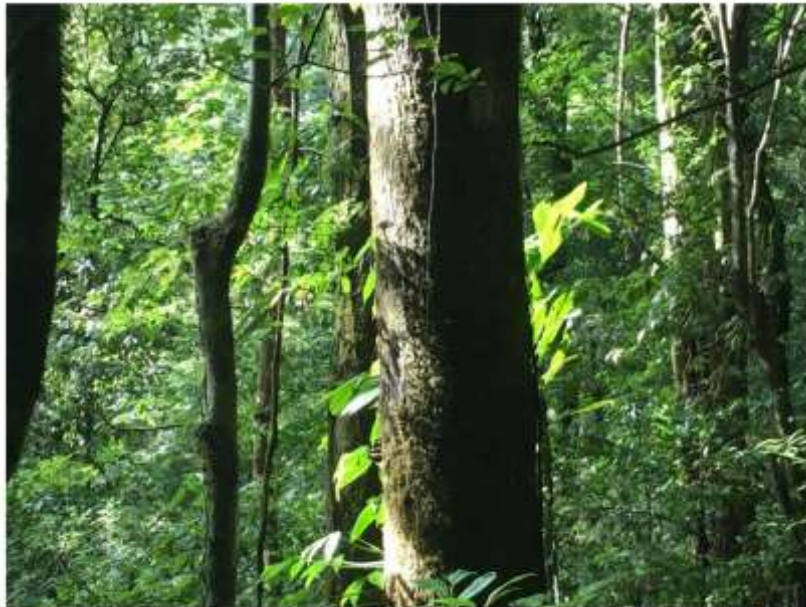
Une forêt à la végétation luxuriante (PB)

D'abord, le visiteur longe l'étonnant rio Celeste aux eaux rendues turquoise par la réaction chimique entre le soufre et le carbonate de calcium rejetés par le volcan Tenorio qui dominerait l'horizon s'il n'était le plus souvent caché dans les nuages. Puis, il aboutit à une cascade, plus loin, à des sources thermales.