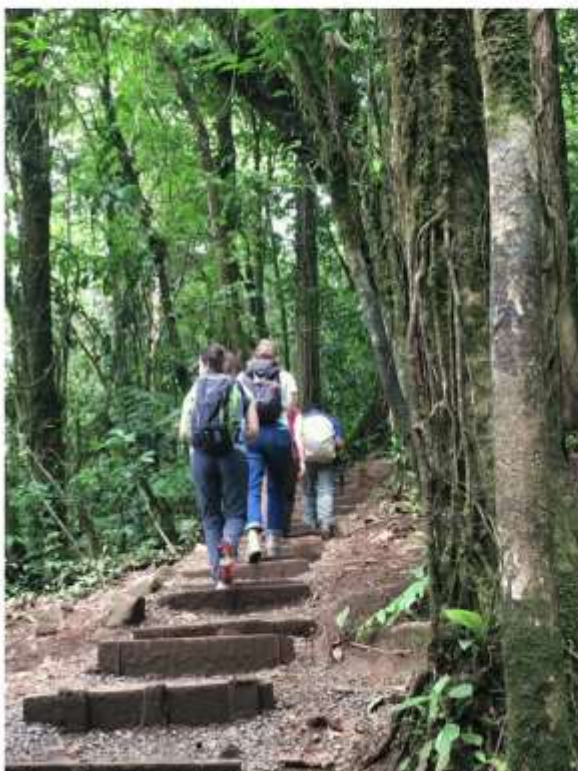
Les escaliers et les montées du sentier de découverte sont plus d'une fois exigeantes (PB)

Depuis que cette route a été goudronnée, les touristes se bousculent dans cette vallée située au nord du Costa Rica et le restaurant de doña Casta ne désemplit plus. En avril dernier, pendant le week-end de Pâques, c'était même la cohue ! Les habitants du coin en sont encore abasourdis ! Mais cela fait les affaires de Alex, l'un des fils de doña Casta, qui est guide dans le Parc national du volcan Tenorio dont l'entrée se trouve quelques kilomètres plus haut. C'est là qu'un sentier de découverte a été aménagé.