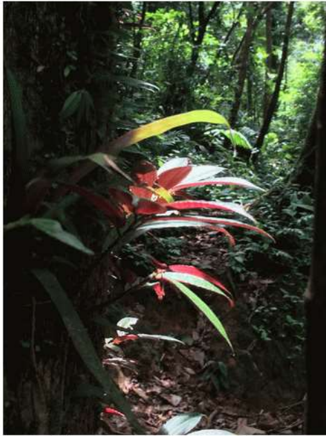
Jeu de végétation et de couleurs dans la forêt (PB)

La balade permet de s'immerger dans une exubérante végétation tropicale : les arbres courent jusqu'au ciel, des broméliacées et d'autres plantes épiphytes les colonisent, des lianes en tous genres les escaladent. Souvent, des fougères arborescentes jaillissent au milieu de la mousse et des lichens.