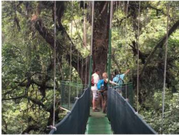
Un balcon qui permet de tutoyer les arbres, tout en haut (PB)