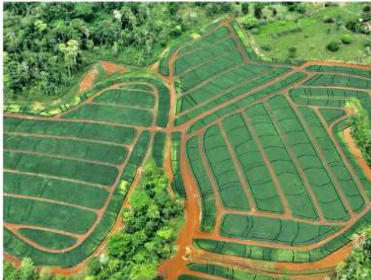
Au nord du Costa Rica, près du lac Nicaragua, d'innombrables champs d'ananas à l'allure très graphique, vus d'avion (PB)

D'entrée, le Costa Rica livre ce qu'il a de meilleur. Ce n'est pas sans raison que ce paradis végétal et tropical -il abrite 6 % de la biodiversité mondiale- peuplé d'à peine 5 millions d'habitants (dont 70 % vivent dans la Vallée centrale), passe pour être la « Suisse de l'Amérique centrale ».