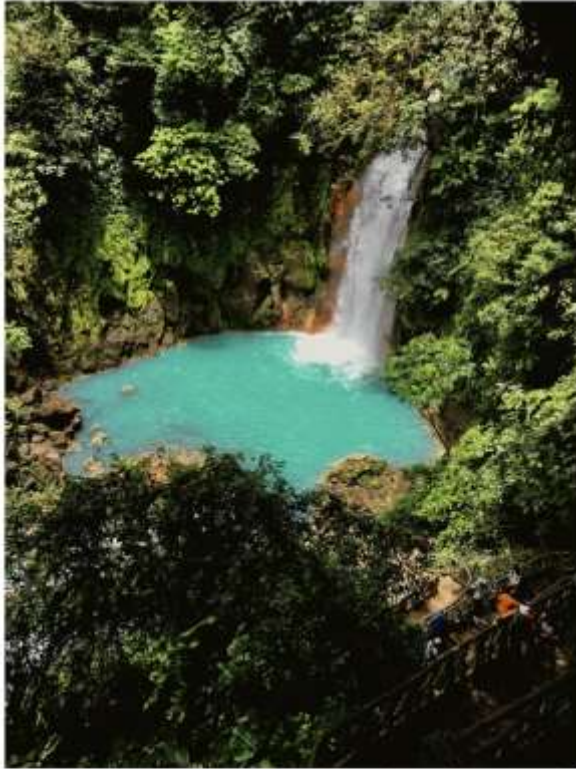
Ici, les étonnantes eaux bleu turquoise du rio Celeste tombent en cascade (PB)

D'abord, le visiteur longe l'étonnant rio Celeste aux eaux rendues turquoise par la réaction chimique entre le soufre et le carbonate de calcium rejetés par le volcan Tenorio qui dominerait l'horizon s'il n'était le plus souvent caché dans les nuages. Puis, il aboutit à une cascade, plus loin, à des sources thermales.